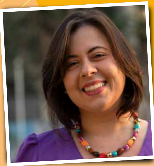
Sâmia Bomfim Líder do PSOL na Câmara dos Deputados