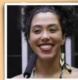
Talíria Petrone Rio de Janeiro

Institui a Política Nacional de Promoção de Parto Humanizado, Digno e Respeitoso.