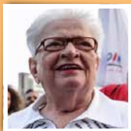
Luiza Erundina São Paulo